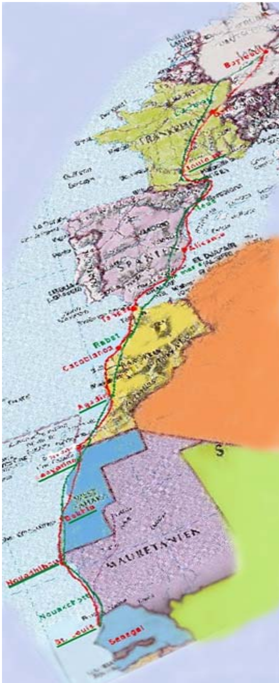
Route Bayreuth nach Saint Louis du Sénégal